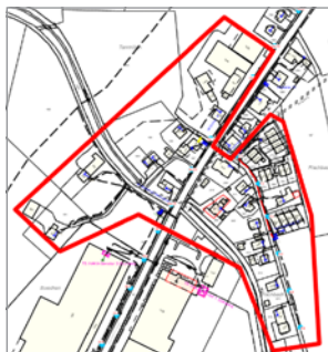
Betroffener Bereich Fischbach