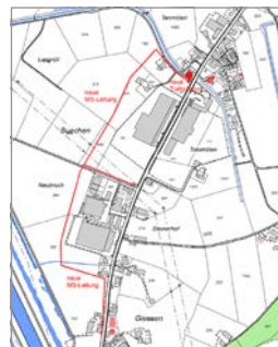
Neue Mittelspannungs-Leitung und neue Trafostation Buechen