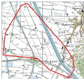
Betroffenes Gebiet im südwestlichen Teil von Benken